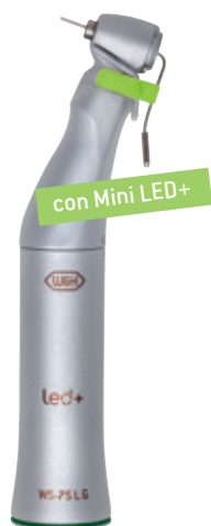
WS-75 L G desmontable