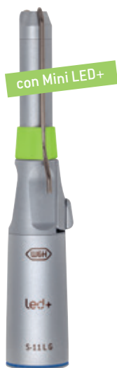
S-11 L G desmontable