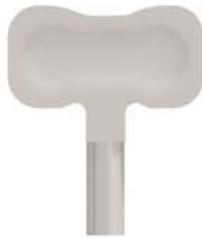
KF001 LLAVE MARIPOSA